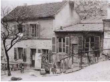
LE LAPIN AGILE ROND 1885