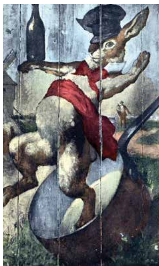
PANEEL LAPIN AGILE