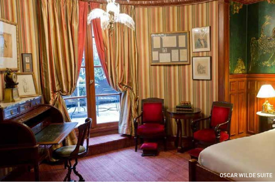
OSCAR WILDE SUITE