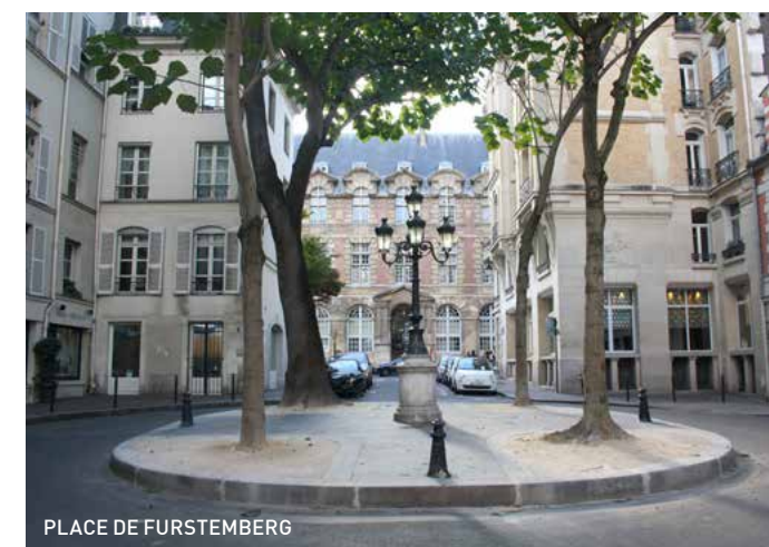
PLACE DE FURSTEMBERG

Als we de dag hier vanavond gaan afsluiten, bedenken we dat onder anderen Voltaire, Balzac, Diderot en Victor Hugo ons zijn voorgedaan