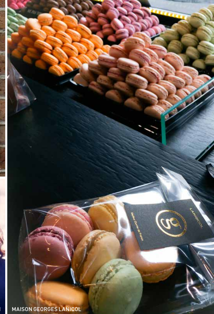
MAISON GEORGES LARNICOL

DE PLATTEGROND VAN HET 6E ARRONDISSEMENT WORDT gedomineerd door de 23 hectares tellende Jardin du Luxembourg, dat dankzij de grote vijver, brede lanen, terrassen en standbeelden het meest geliefde park van de lichtstad is. Het is bovendien een uitstekend startpunt voor een mooie wandelroute door het noordelijke deel van het arrondissement, waar bijna elke straat wel een verhaal met zich meedraagt.