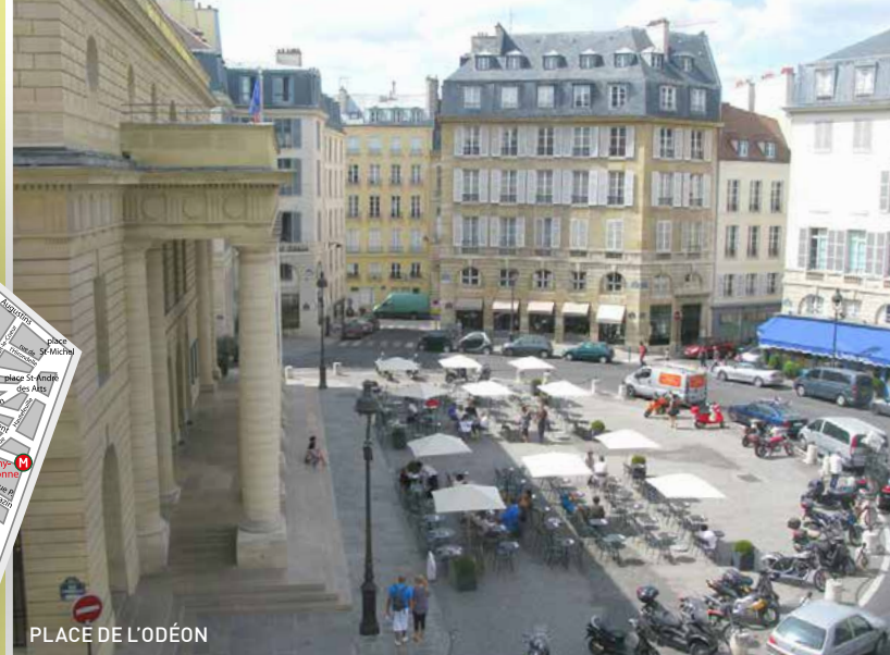
PLACE DE L'ODÉON