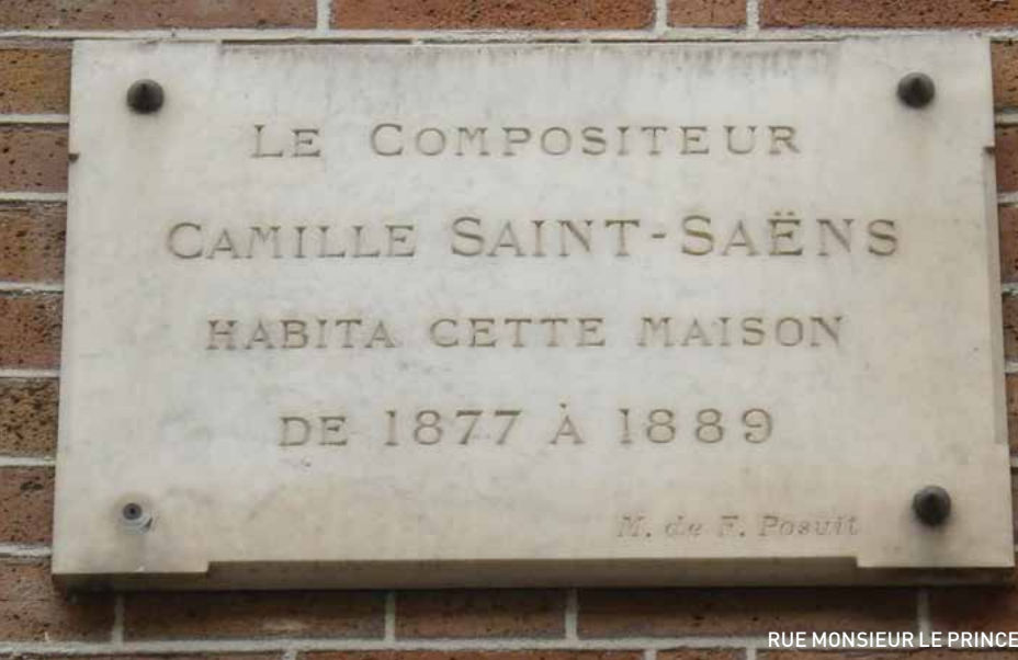
RUE MONSIEUR LE PRINCE