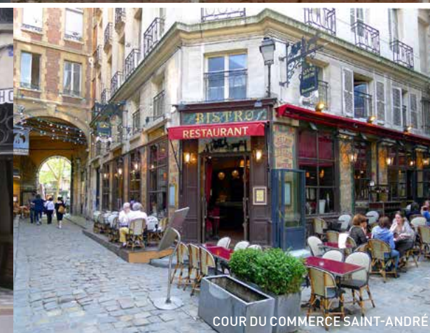
COUR DU COMMERCE SAINT-ANDRÉ