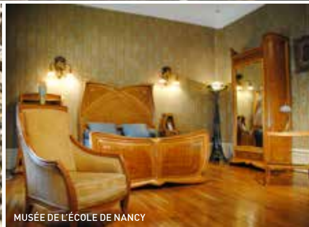
MUSÉE DE L'ÉCOLE DE NANCY

'rijtjeshuizen' aan de rue Félix Faure. Hoe luxueus en rijk gedecoreerd dergelijke huizen en boudoirs destijds waren ingericht, zien we in het Musée de l'École de Nancy; een aangenaam, niet te groot museum waar je je moeiteloos in een roman van Guy de Maupassant waant.