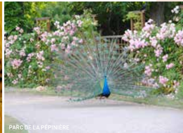
PARC DE LA PÉPINIÈRE