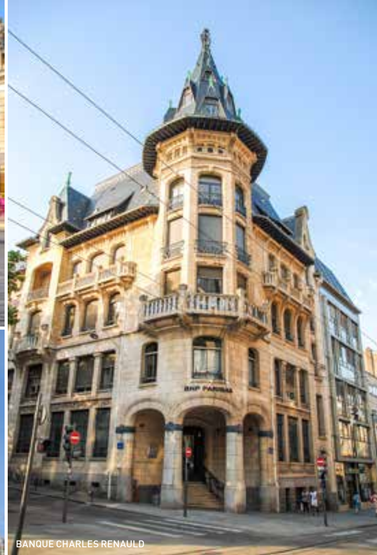
BANQUE CHARLES RENAULD

het centrumdeel ten noordwesten van het plein, want dat dateert grotendeels nog uit de middeleeuwen en de renaissance.