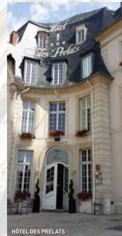
HÔTEL DES PRÉLATS

56, place Mgr. Ruch www.hoteldesprelats.com