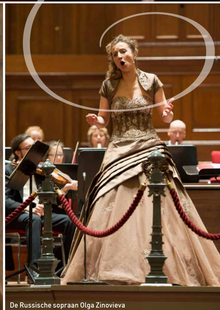
De Russische sopraan Olga Zinovieva